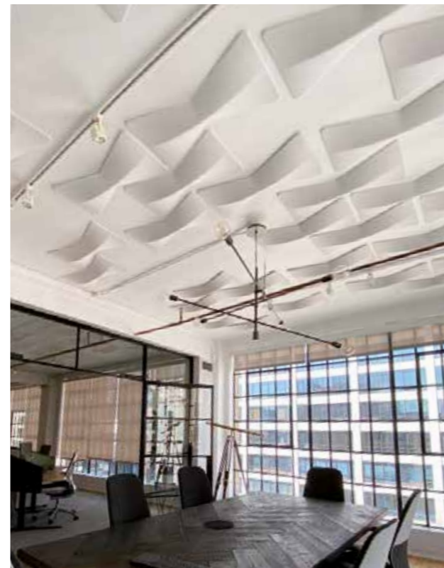
Tangram Interiors, Los Angeles (U.S.A.)